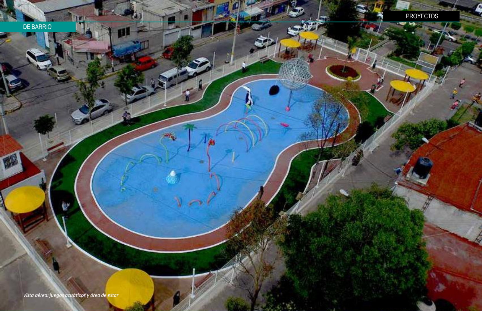
Vista aérea: juegos acuáticos y área de estar