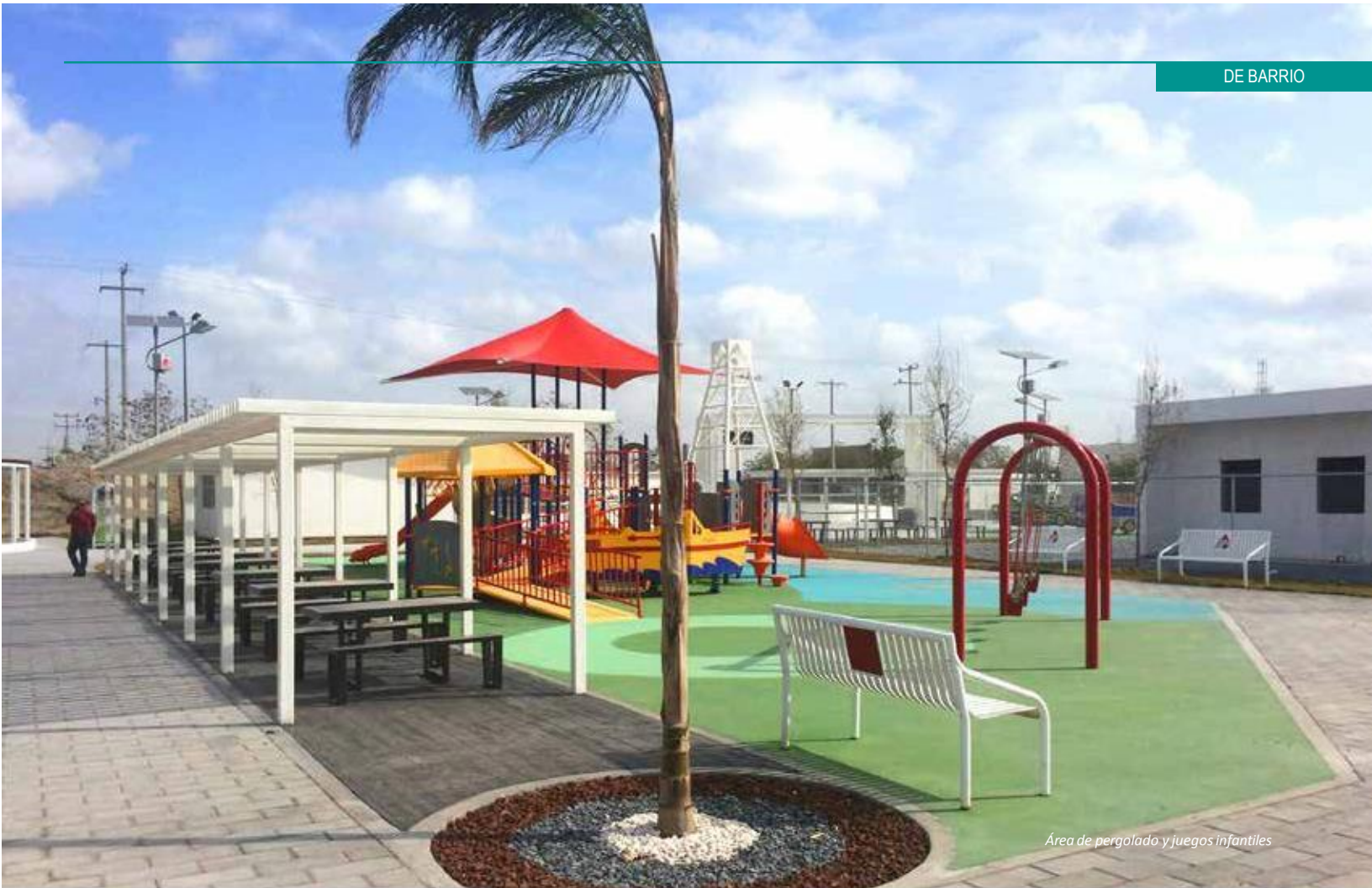
Área de pergolado y juegos infantiles