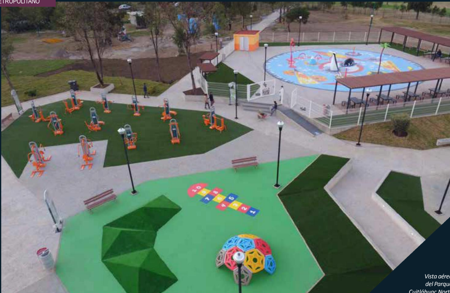
Vista aérea del Parque Cuitláhuac Norte