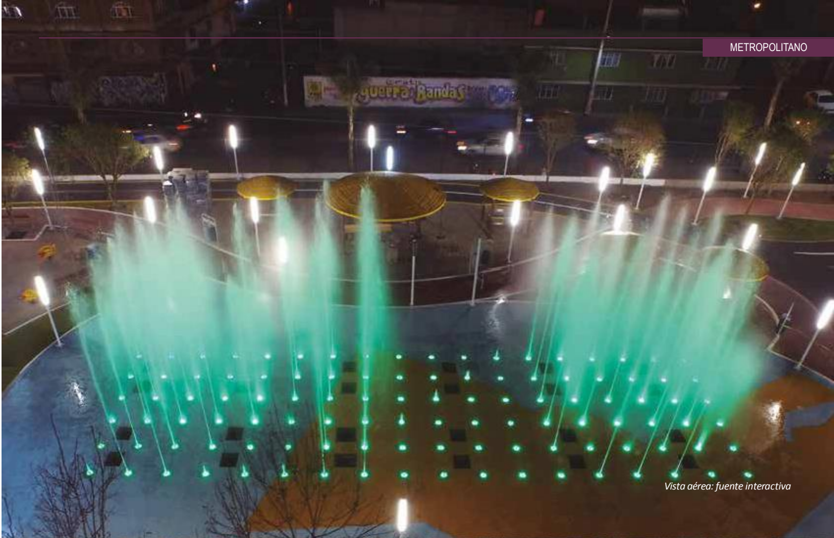
Vista aérea: fuente interactiva