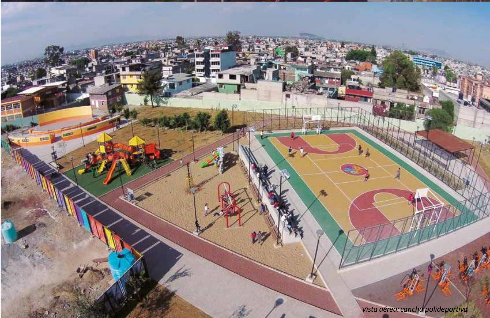
Vista aérea: cancha polideportiva