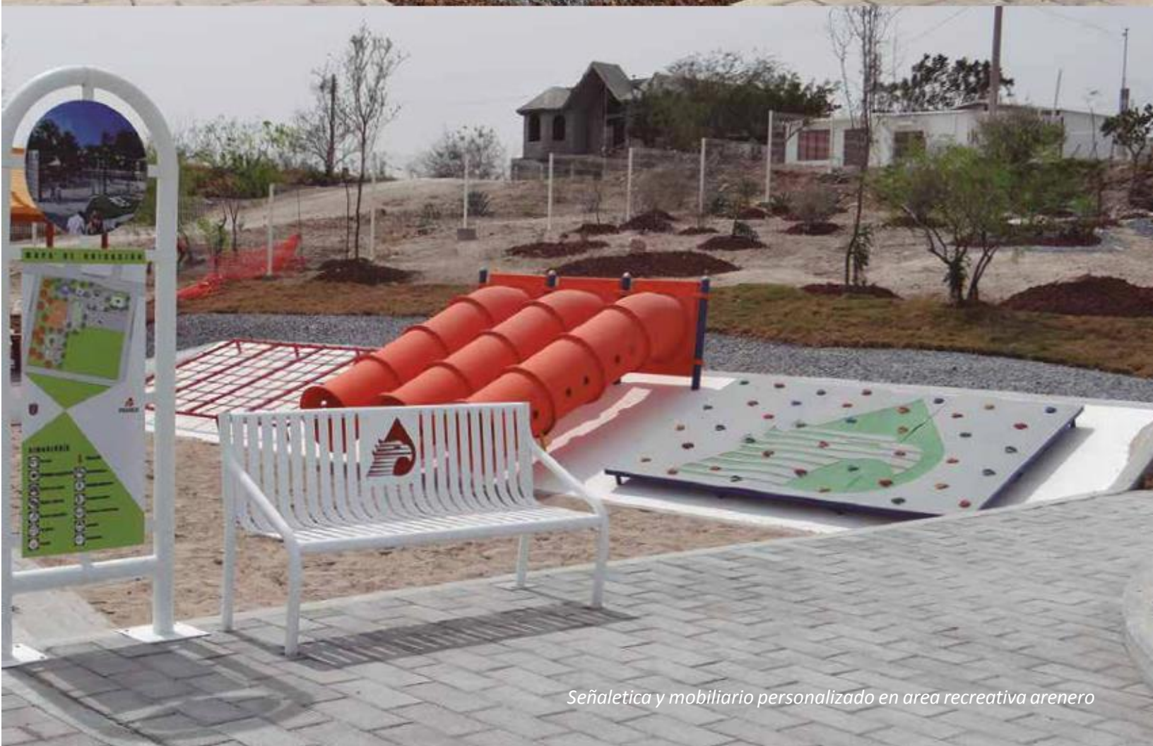
Señalética y mobiliario personalizado en área recreativa arenero