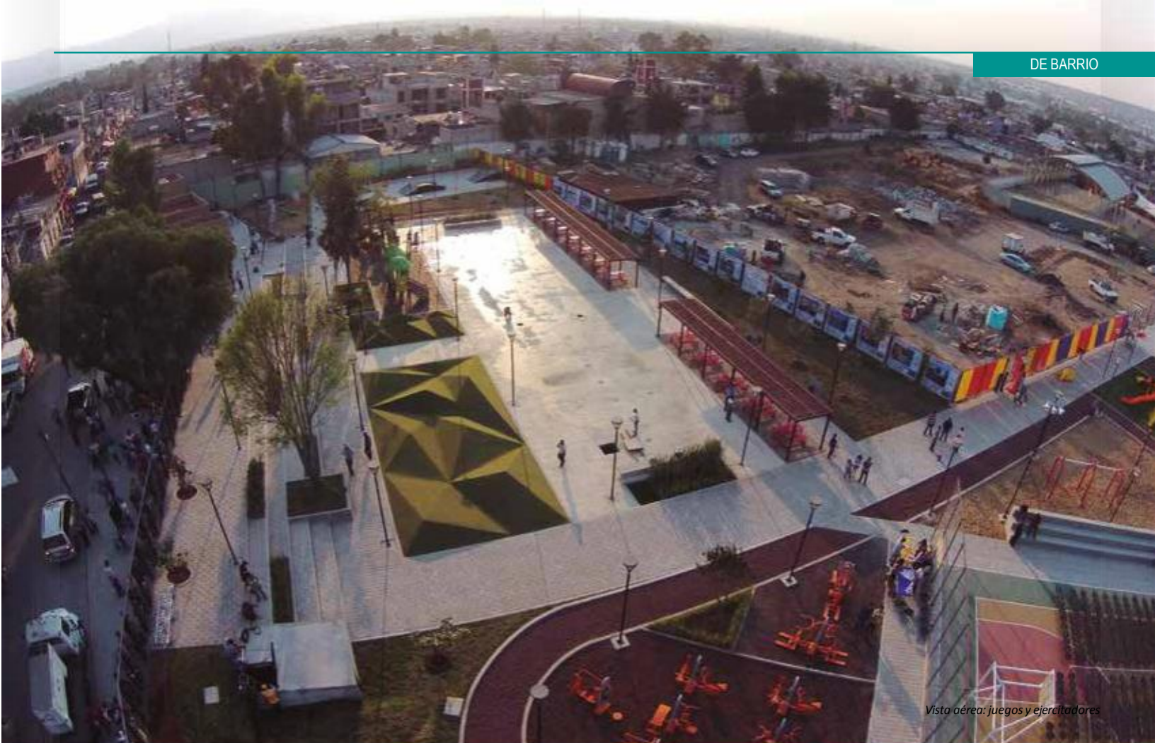
Vista aérea: juegos y ejercitadores