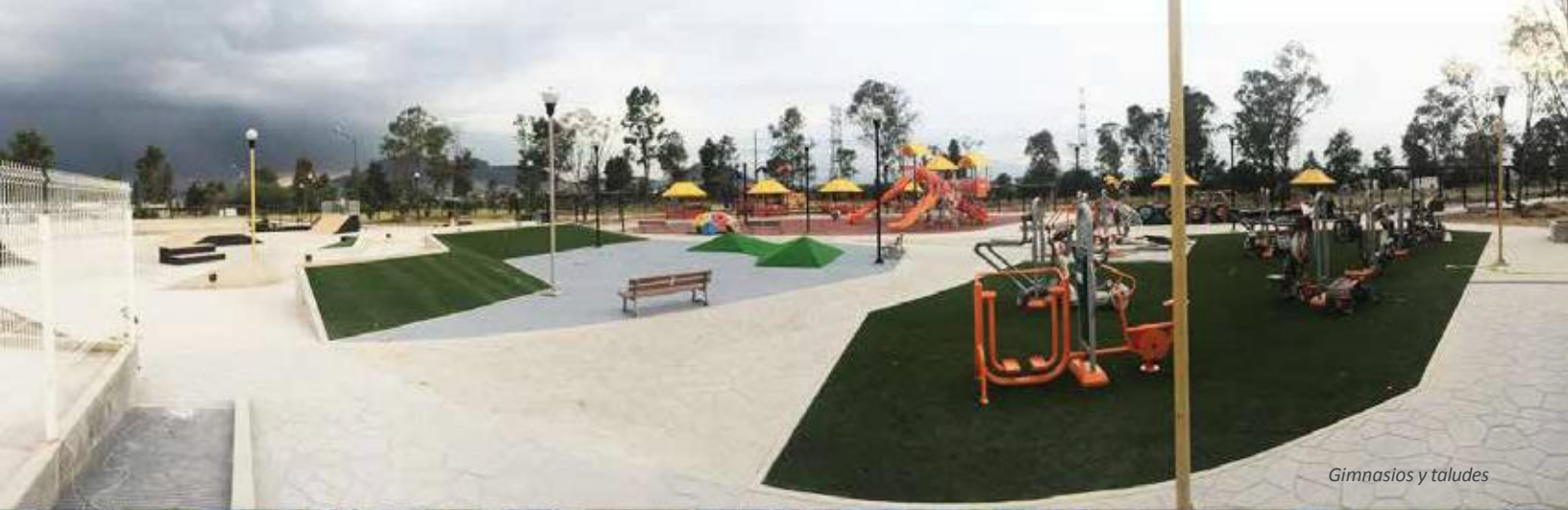
Gimnasios y taludes