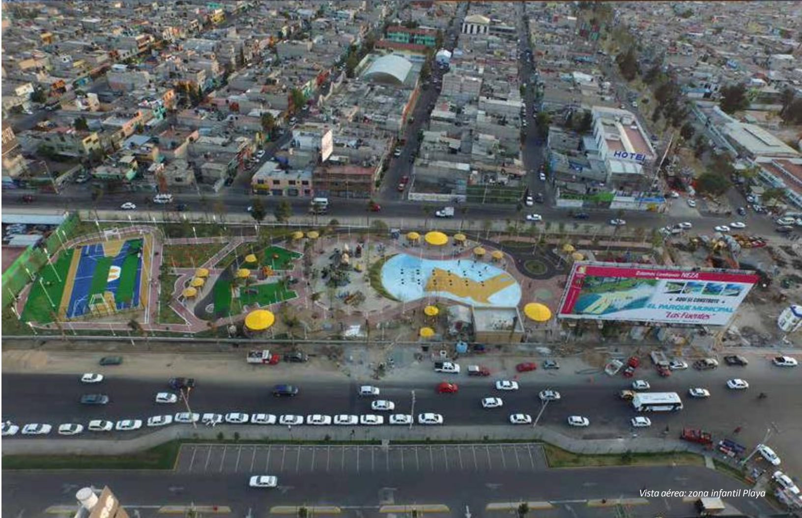
Vista aérea: zona infantil Playa