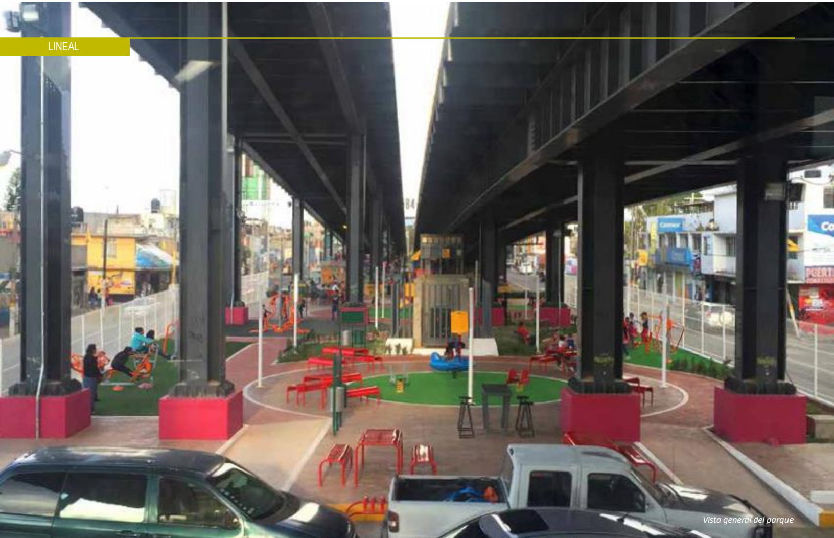
Vista general del parque