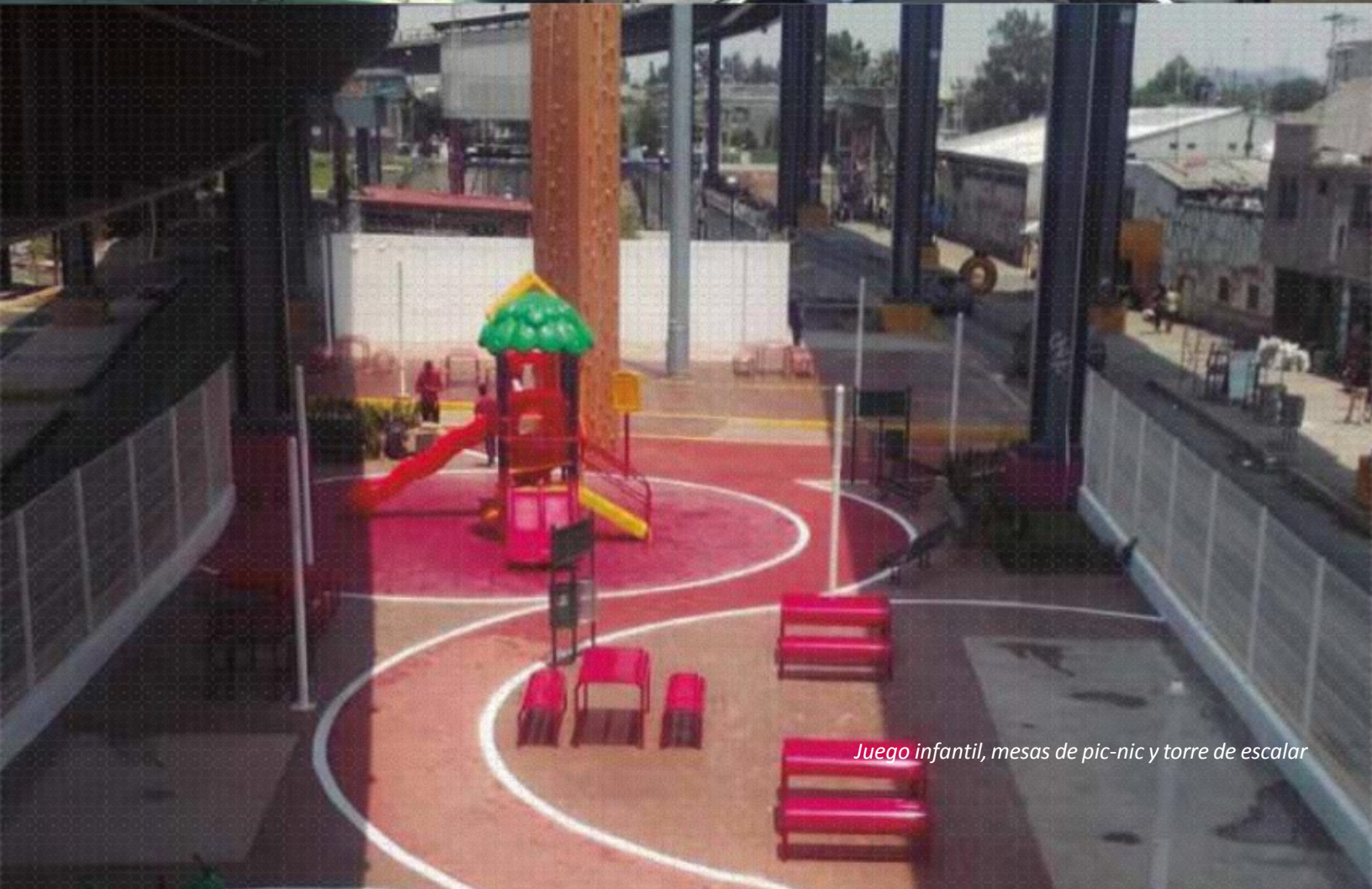
Juego infantil, mesas de pic-nic y torre de escalar