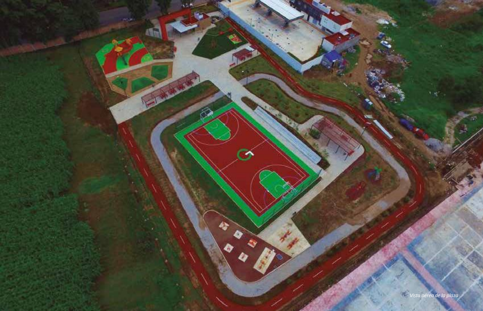
Vista aérea de la plaza