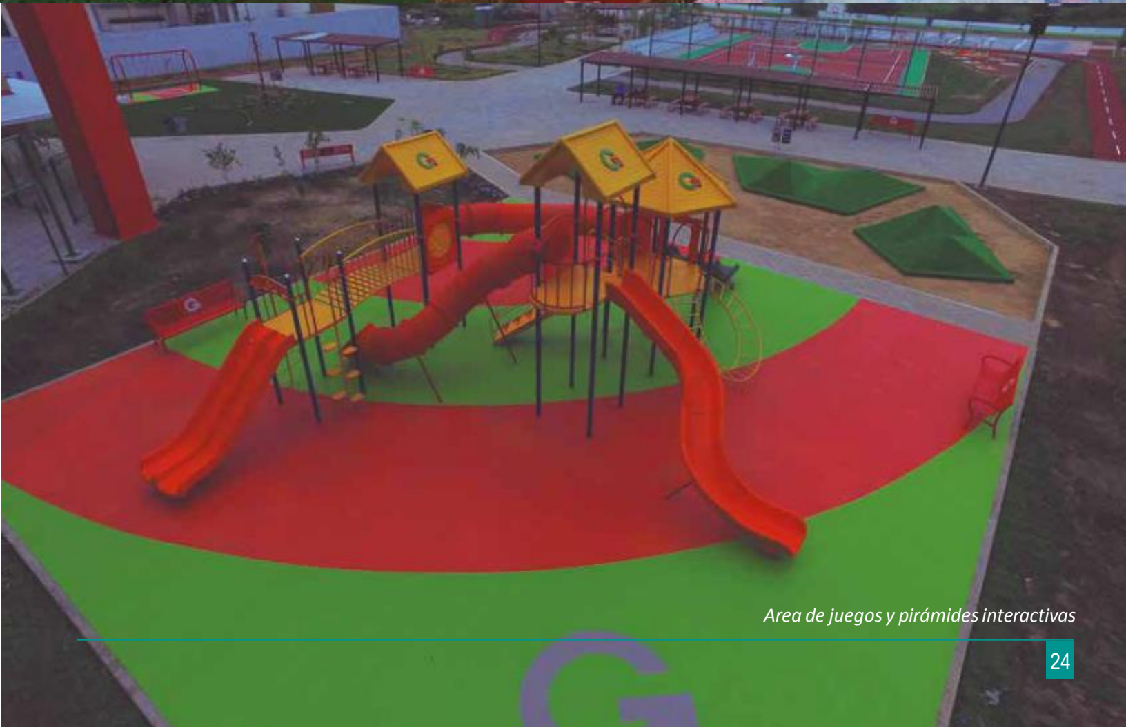
Area de juegos y pirámides interactivas