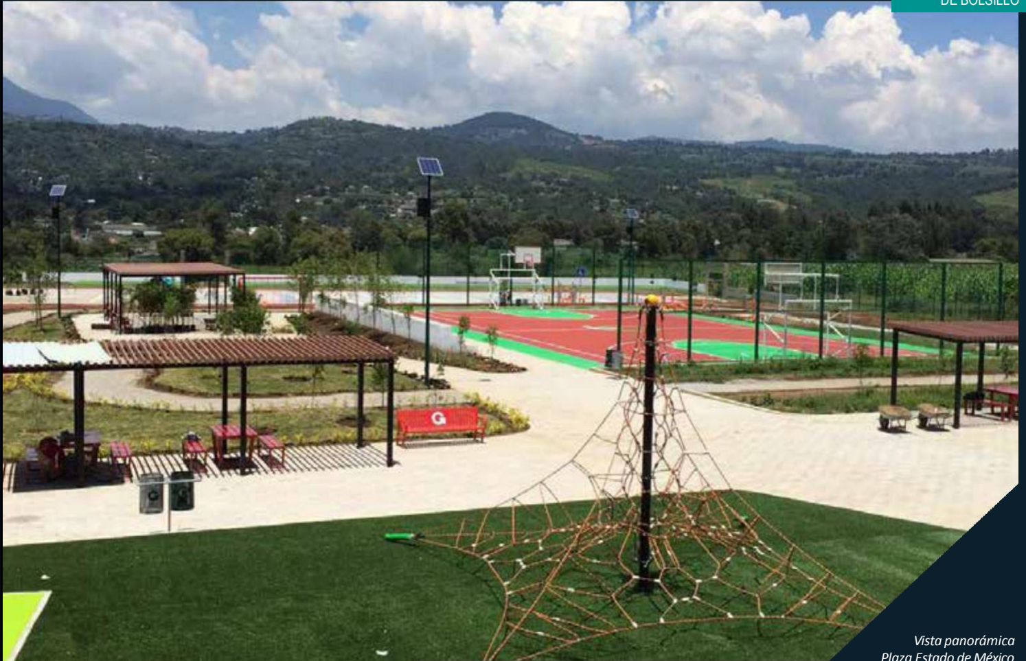
Vista panorámica Plaza Estado de México

Ubicación: Calle Madero S/N Conjunto El Vergel, Tenancingo, Estado de México Género: Obra Nueva Dimensiones: 6 115 m 2 Cliente: SAOP / México