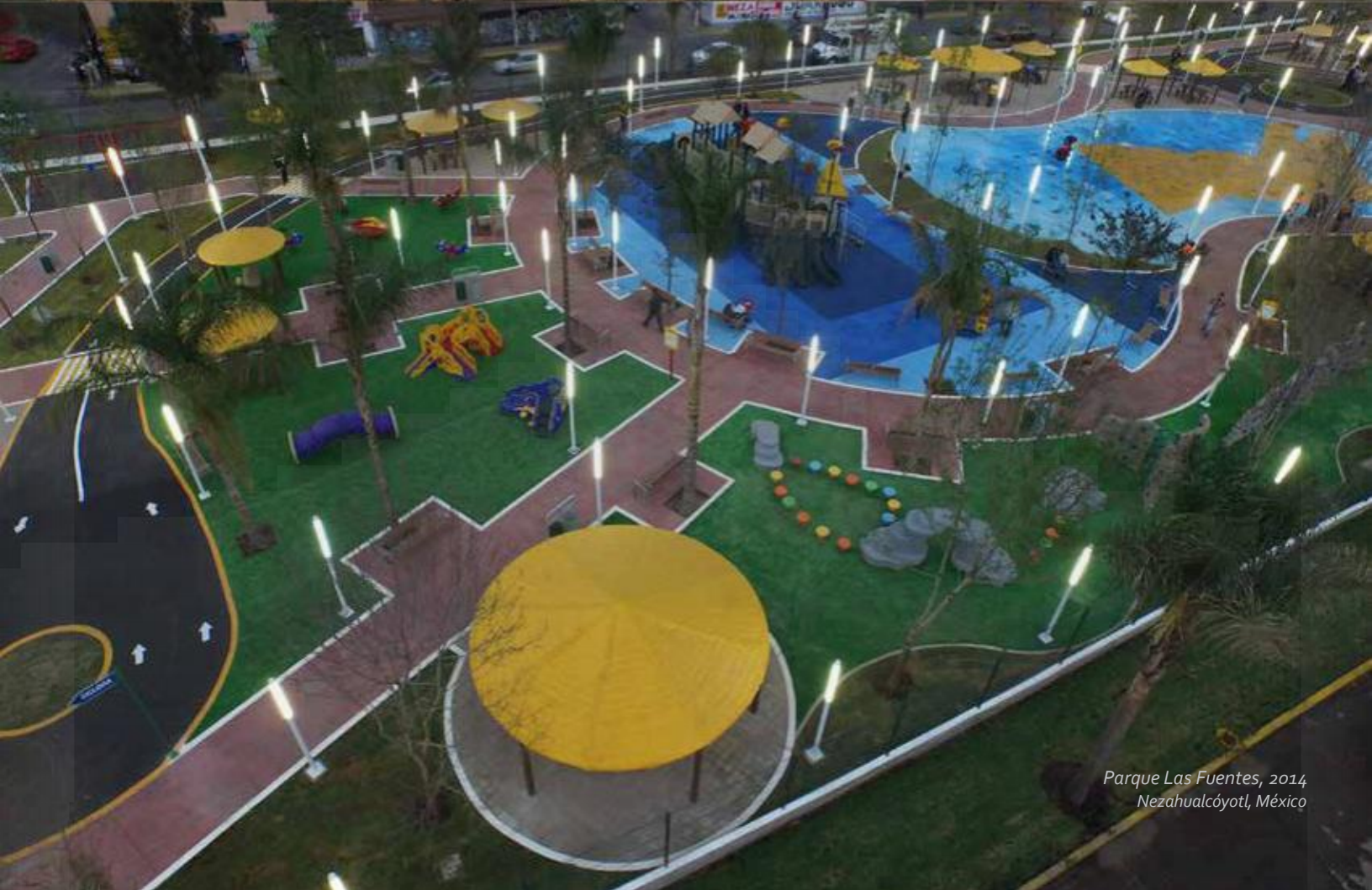
Parque Las Fuentes, 2014 Nezahualc6yotl, M6xico